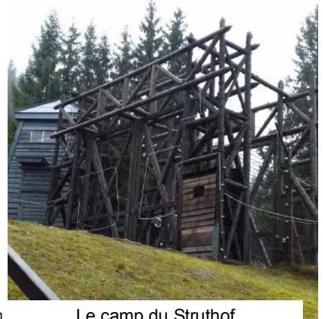
Le camp du Struthof