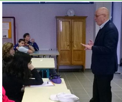
Les élèves de 3e Prépa pro rencontrent M. Vuillaumé, député de la deuxième circonscription de Haute-Saône