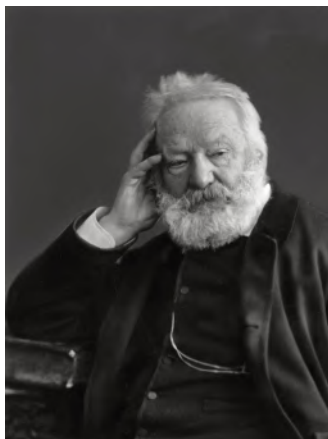
Ruy Blas de Victor Hugo ? Ça peut être drôle ?

J'ai beaucoup aimé la pièce car je l'ai trouvée intéressante et les comédiens étaient convaincants. Ils m'ont bien fait rigoler et j'ai bien aimé le concept de jouer avec le public. J'ai compris le déroulement de la pièce et la scène proposée était compréhensible. Franchement c'était très marrant.