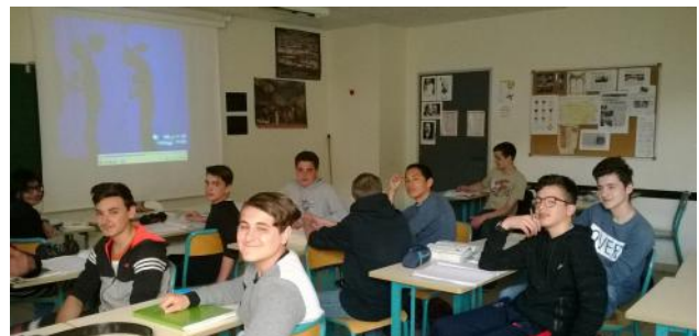
Dernière étape du projet, la classe visionne la vidéo réalisée pour le concours.