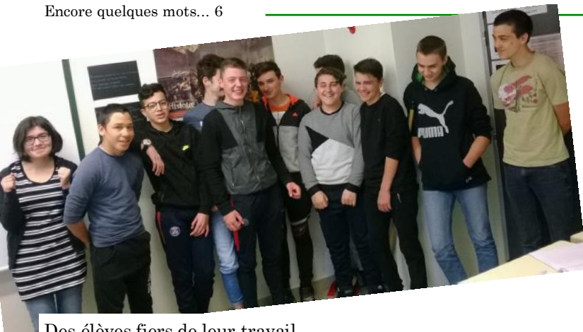
Des élèves fiers de leur travail.