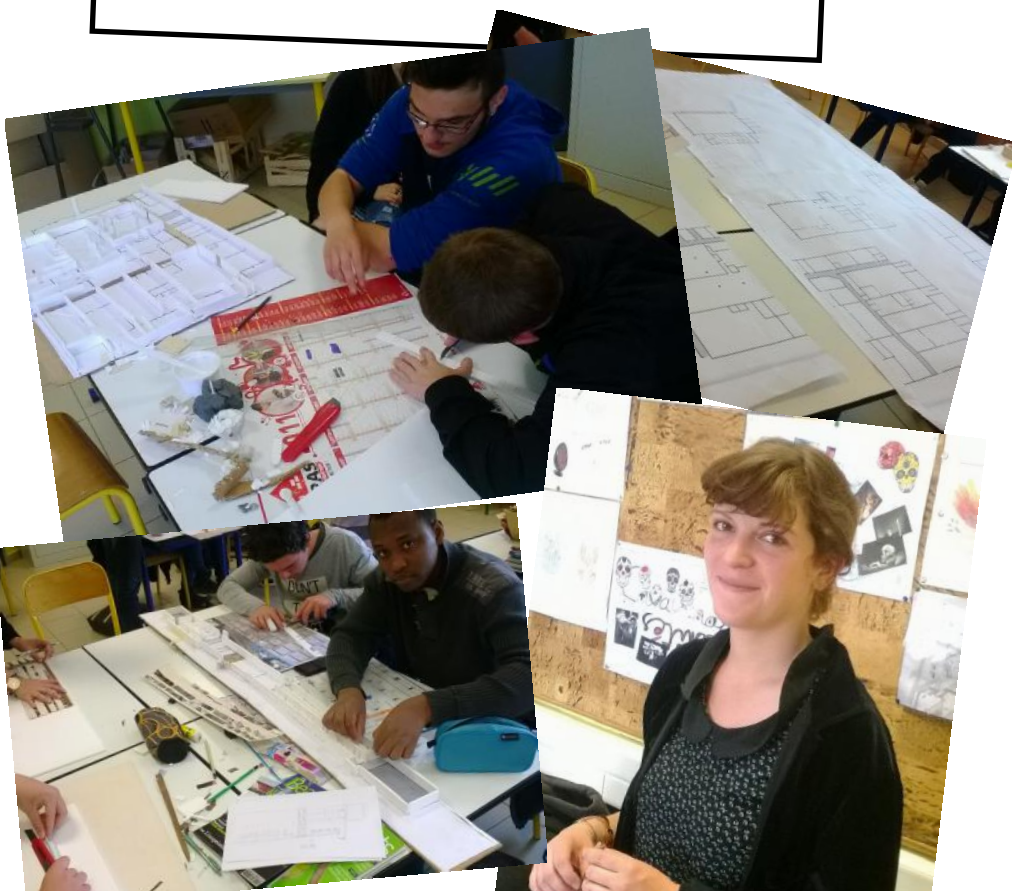
Quelques photos du projet « architecture et patrimoine mené par M. Steegmann et une architecte avec la classe de 1CAP MA.CA.SM