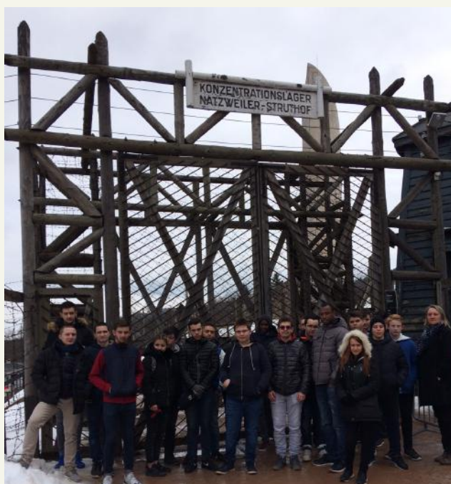
Mardi 6 mars 2018, visite du camp du Struthof.