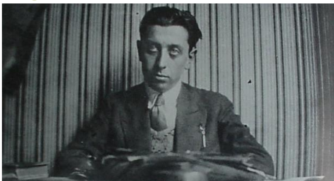
Robert Desnos

En cours de français, nous avons étudié plusieurs textes de résistants parce que les écrivains aussi se sont engagés. Mais nous avons choisi de parler de Robert Desnos parce que c'est un poète mais c'est aussi un journaliste radio.