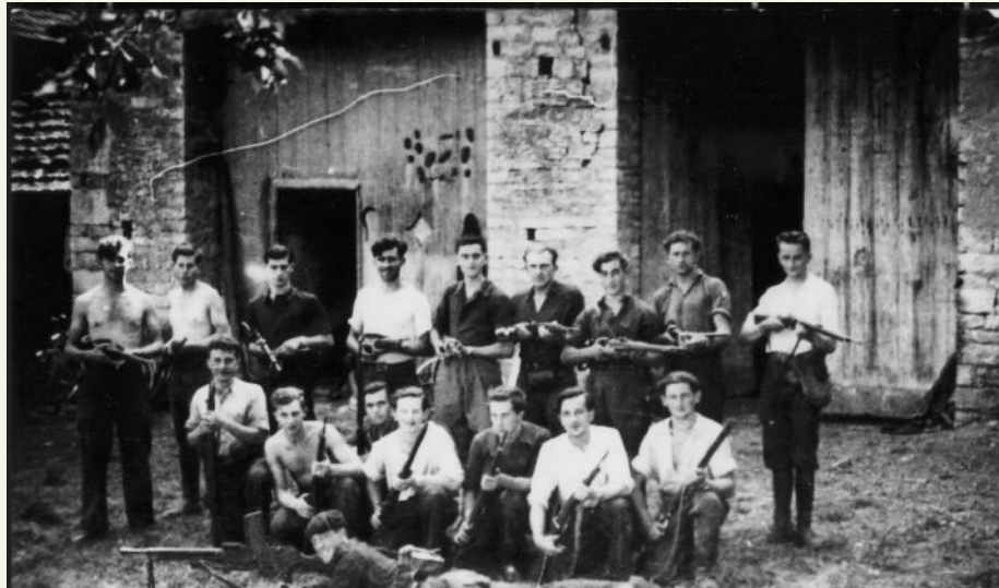
Le maquis des Monnier à Villersexel