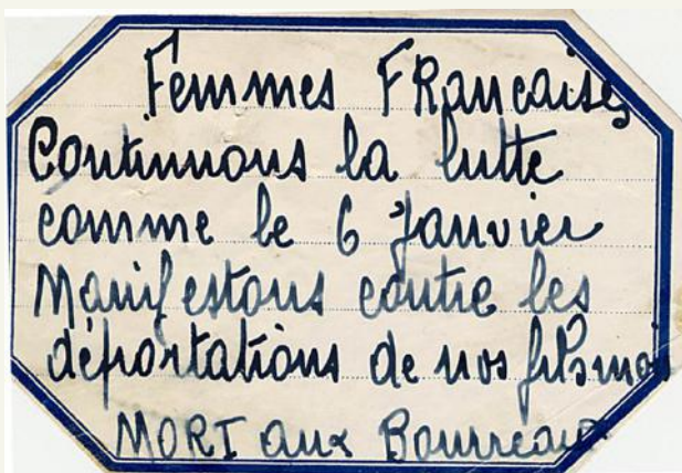
Tract de la Résistance