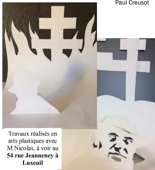
Travaux réalisés en arts plastiques avec M.Nicolas, à voir au 54 rue Jeanneney à Luxeuil