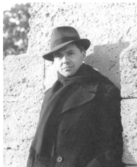
Jean Moulin